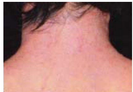
図5 アトピー性皮膚炎*