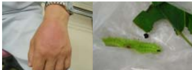
ヒロヘリアオイラガによる毛虫皮膚炎 他にチャドクガも皮膚炎を起こす