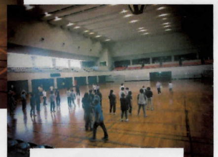
サッカーじゃんけん