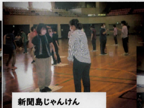
新聞島じゃんけん