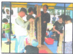
お父さん、おじいちゃん 子ども以上に積み木に集中する