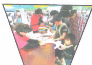
子ども達との接触で いろいろな事に挑戦