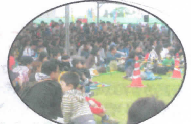
子ども達人気の催しもの会場