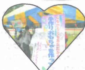
きれいな看板を主催者準備