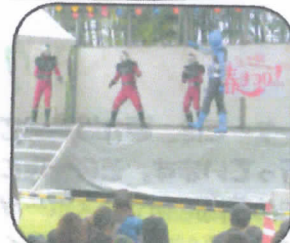
特命戦隊ゴバスターズショー