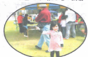
自分で作成した折り紙たこ を自慢そうに飛ばす