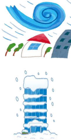
風・雹・雪災、水災による支払共済金の推移

平成30年度までの自然災害の影響を反映した前回の改定以降も令和元年度台風15号による風災、台風19号による水災、令和2年度の爆弾低気圧による雪災といった大規模な自然災害が発生し、自然災害のリスクが一層高まっていることから、共済掛金を改定しました。